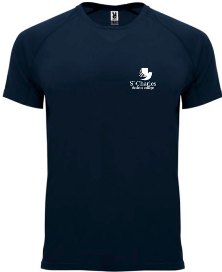
Couleur textile : Bleu marine